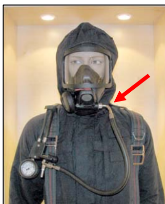
Slang med vinklad koppling

Andnings slangen som går från manöverenheten har vid masken haft en vinklad koppling. Från juni 2008 kommer den att ersättas av en slang med rak koppling. Den raka kopplingen ger bättre följsamhet vid huvudvridningar.