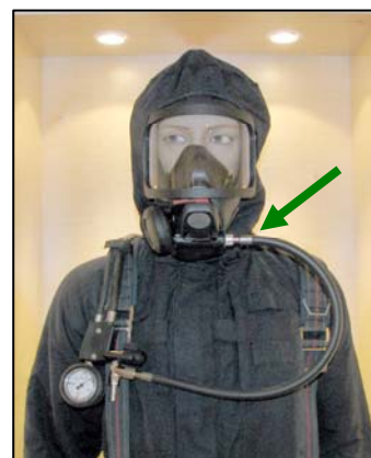
Slang med rak koppling